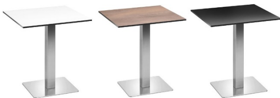
Tisch 3 mit Metallfuß in den Farben weiß, Eiche oder schwarz