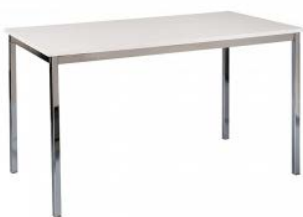
Tisch 2 mit Metallgestell, weiße Platte