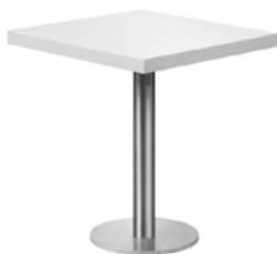
Tisch 1 mit Metallfuß, weiße Platte