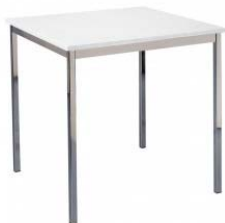
Tisch 1 klein, weiße Platte