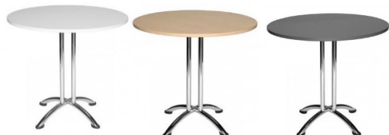
Tisch 3 mit Metallgestell in den Farben weiß, Ahorn oder grau