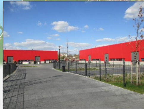
Handwerker- und Gewerbehof