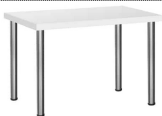
Tisch 2 mit Metallgestell, weiße Platte