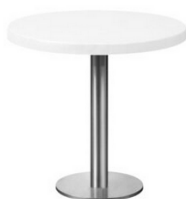
Tisch 1 mit Metallfuß, weiße Platte