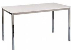
Tisch 2 mit Metallgestell, weiße Platte