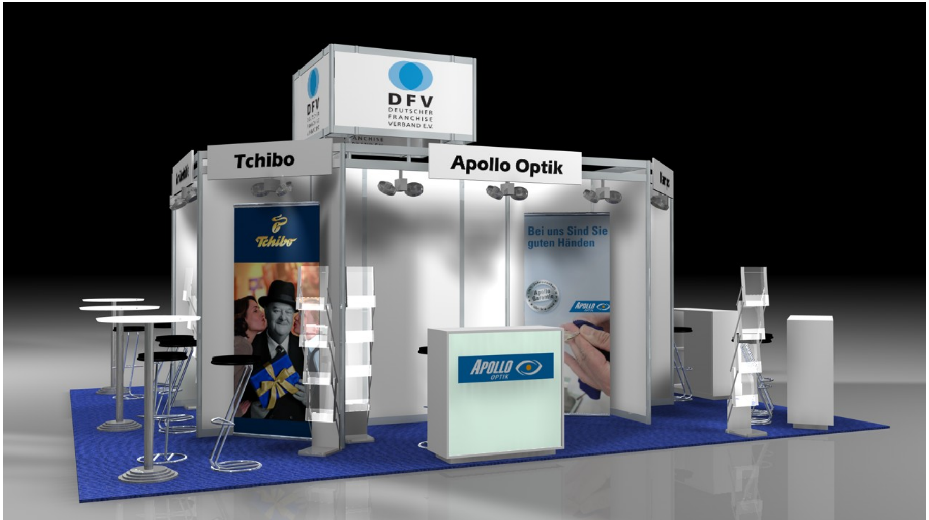
Standausstattung 6 m 2 Teppich, KSM – Theke mit Logo, 2 Barhocker, 1 Prospektständer, Ausstellerblende