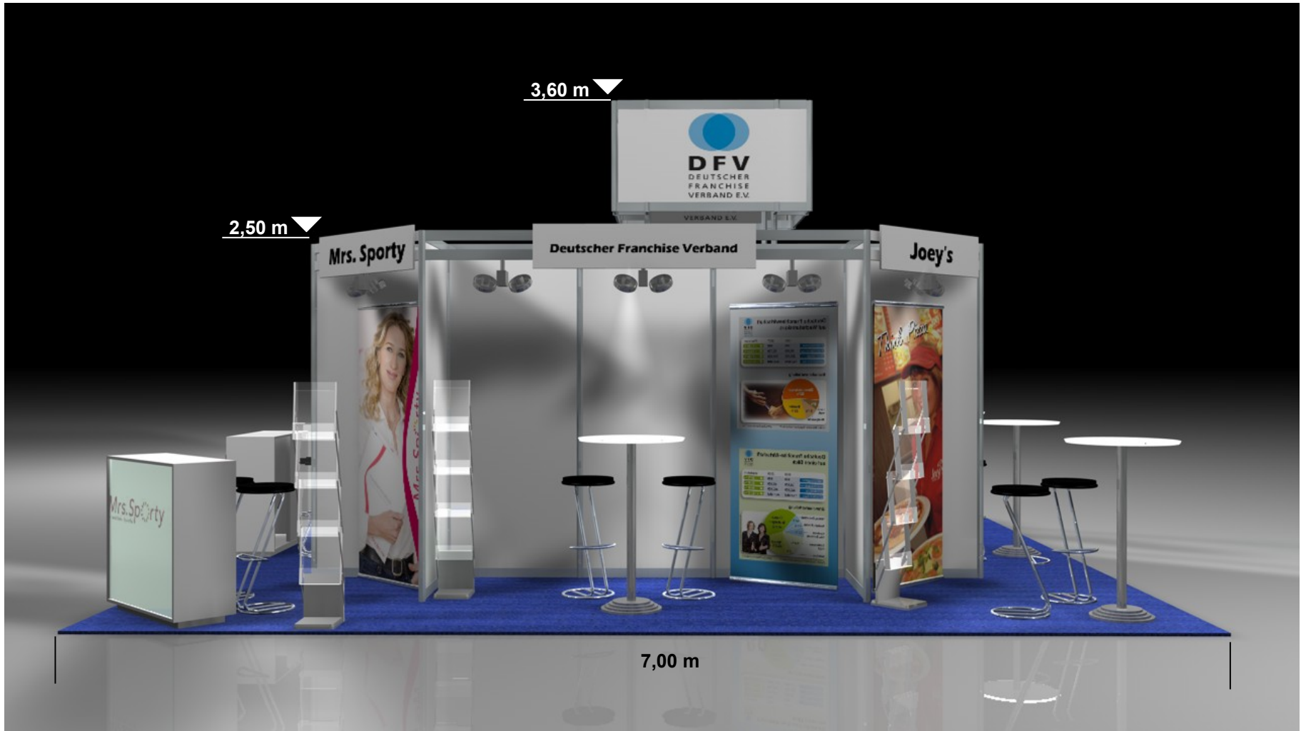
Standausstattung 6 m 2 Teppich, 1 Stehtisch mit Glasplatte, 2 Barhocker, 1 Prospektständer, Ausstellerblende