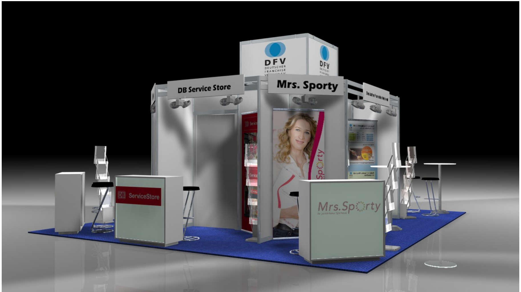
Standausstattung 4 m 2 Teppich, KSM – Theke mit Logo, 2 Barhocker, 1 Prospektständer, Ausstellerblende